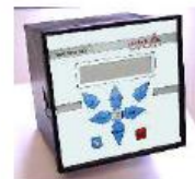
UFM 535 SC

Integrované jsou také časový výstup nebo závislé řízení množství vzorkovače. Ten je naprogramovatelný a parametrizovatelný integrovanou klávesnicí. Všechna data jsou uchována přinejmenším 5 let ve vnitřní paměti zálohované baterií.