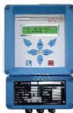
UFM 535 W4

Měřicí převodník UFM 535 může ovládat měření, řídit a monitorovat zadané úlohy. To řídí celé měření sekvenčně a nemá nejen limitní hodnoty a analogové výstupy, ale také vzorkuje data systému a optimalizuje kontinuální regulátor ovládající objem odtoku.